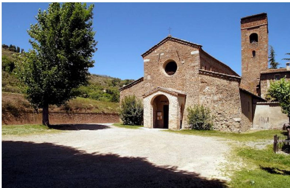
Pieve del THO